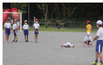
体育委員会主催の「だるまさんがころんだ大会」が楽しかったです。